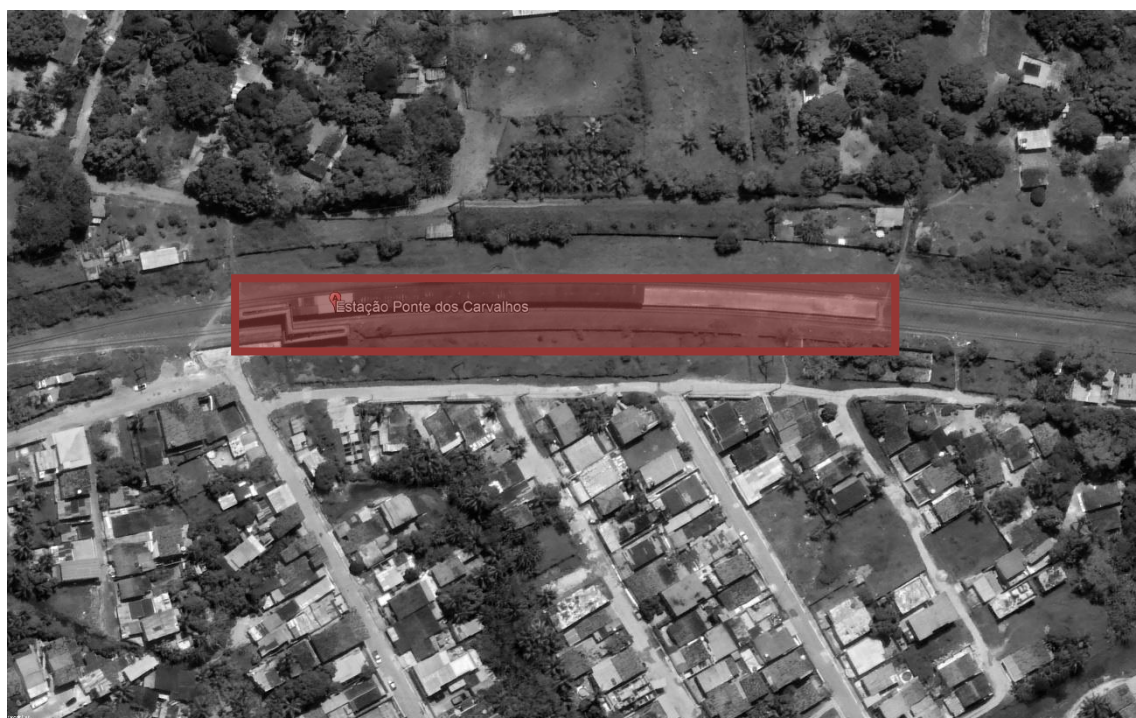
FIGURA 1 – ESTAÇÃO PONTE DOS CARVALHOS